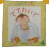
「でておいで」 阿倍 結