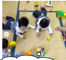
たたみ♥気持ちいいね

いるだけでホッとできる、明るい畳のお部屋です。 駐車場もたくさんありますよ。みんなで、のんびり過 ごしましょう(°ω°)