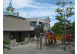
支援ひろばおひさま