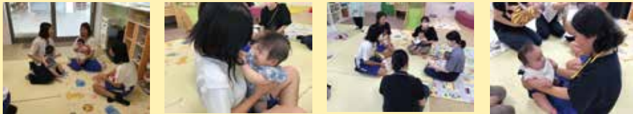
進行役：サンサンスタッフ

中学生と関わりながら遊んでみよう！ 中学生ボランティアとの触れ合いを楽しむ時間です！