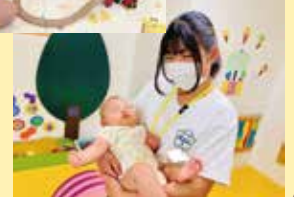
写真は、昨年の様子です

※感染症予防対策を行い、ひろばを開催しています。ひろば開催や講座等を中止する場合があります。 体調不良の方や風邪症状の見られる方は、ご利用をお控えください。